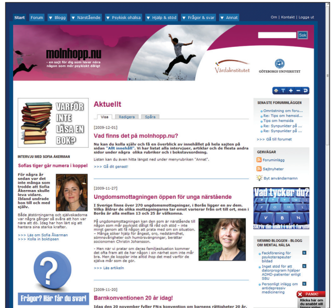
Startsidan på stödsajten www.molnhopp.nu 3 december 2009.